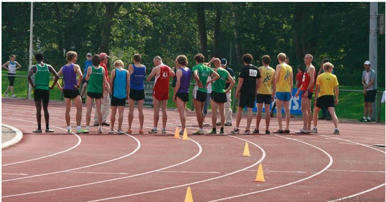
De 1500m op het NSK Baan 2011