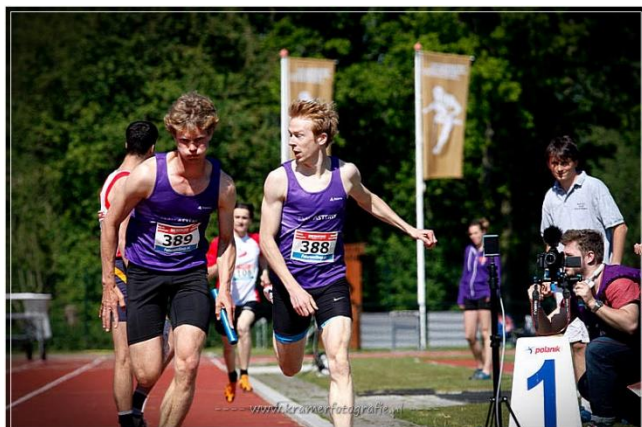
Wissel 4x400m